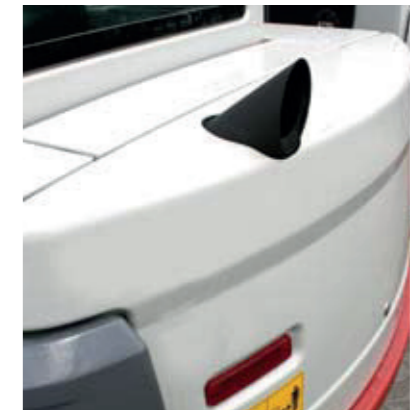
uitlaat omhoog gepositioneerd