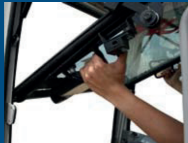
voorruit uitgevoerd met gasveren