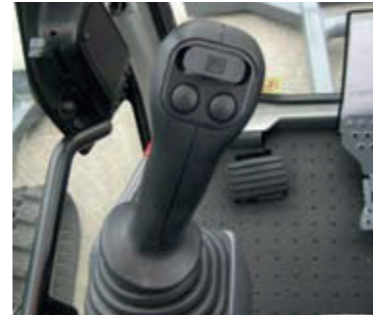
linker joystick standaard uitgevoerd met 'schuifje' voor proportionele aansturing van sloopsorteerfunctie

De Takeuchi 235 heeft standaard één hydraulische functie (onder andere voor hydraulische aansturing van hydraulische hamers of kanteelbakken). Optioneel zijn meerdere hydraulische aansturingfuncties verkrijgbaar (onder andere sloopsorteerfunctie voor proportionele hydraulische aansturing van diverse griepers en draai-kanteelkoppen).