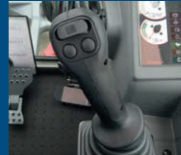
rechter joystick optioneel uitgevoerd met 'schuifje' voor proportionele aansturing van sloopsorteerfunctie