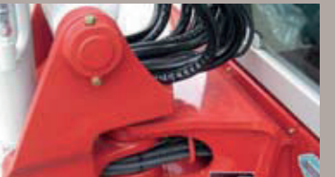
unieke toepassing van demontabele bussen voor de giekophanging in het zwenkstuk