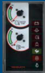
duidelijk afleesbaar instrumentarium